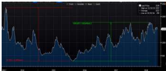
מדד BDI (Baltic Dry Index)