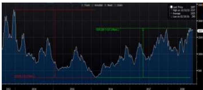
מדד BDI (Baltic Dry Index)