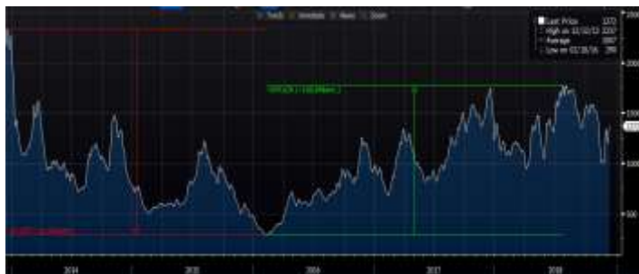
מדד BDI (Baltic Dry Index)