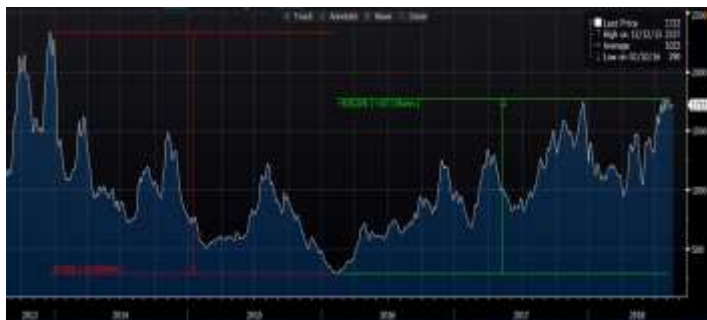
מדד BDI (Baltic Dry Index)