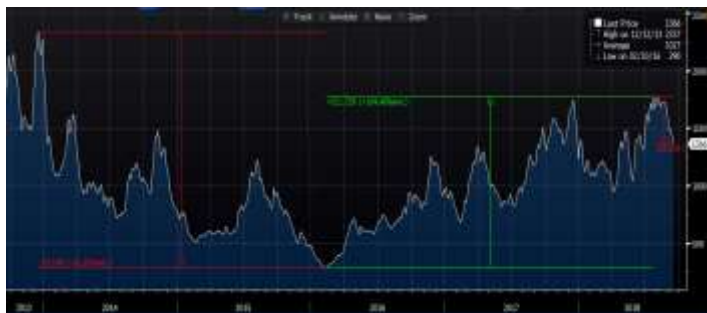
מדד BDI (Baltic Dry Index)