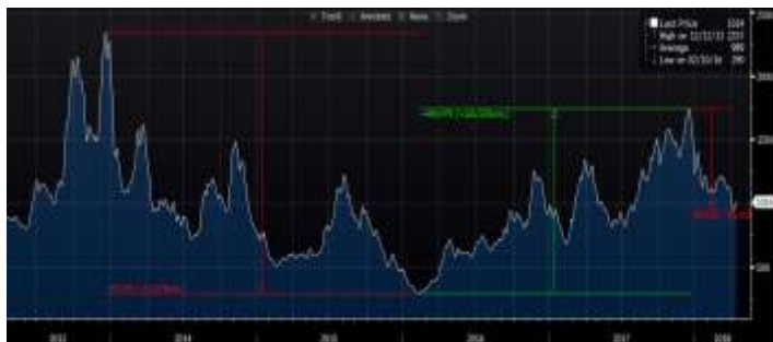
מדד BDI (Baltic Dry Index)