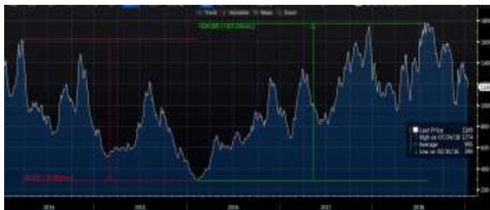
מדד BDI (Baltic Dry Index)