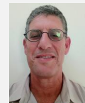
צור שומן מנכ"ל במביפלסט בע"מ