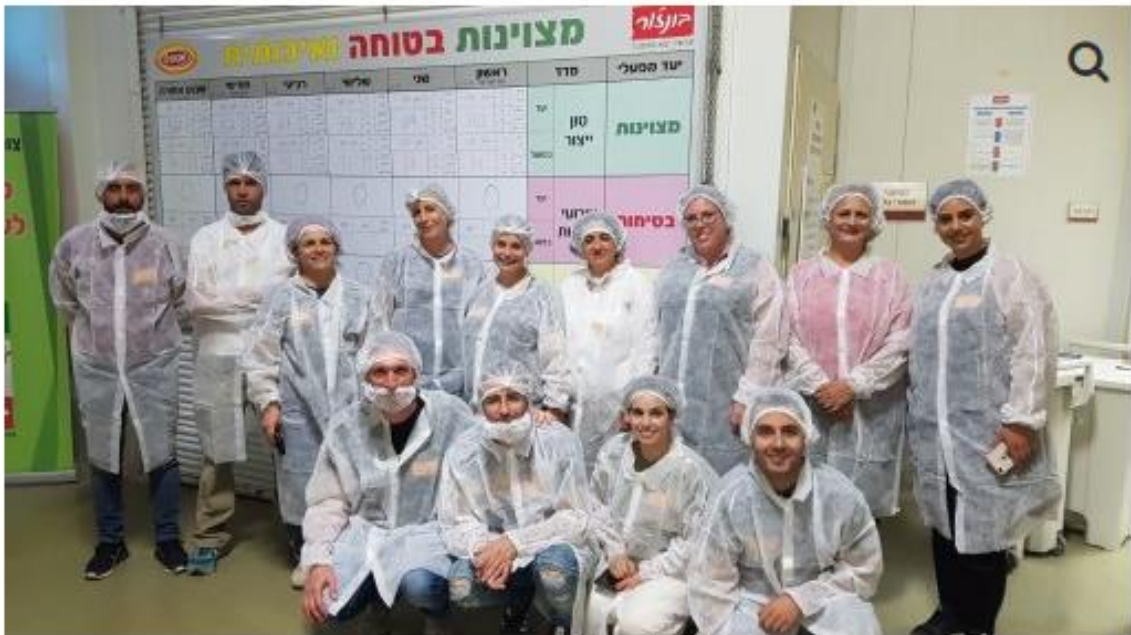
עובדי ומנהלי התאחדות התעשיינים

מנהלי ועבדי המרחבים בצפון ובירושלים הגיעו לבאר שבע ללמוד ולחוות מה עושים בהתאחדות התעשיינים בדרום