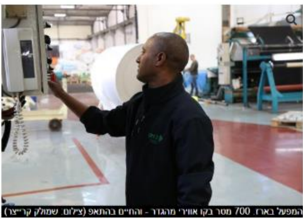
המפעל בארז, 700 מטר בקו אווירי מהגדר - והחיים בהתאם

החברה נחשבת מאוד בעולם והיא הגדולה ביותר שעוסקת בתחום ומייצרת בתקנים בינלאומיים, בין היתר לארצות הברית ולאוסטרליה. בנוסף למפעל בארץ ישנו אתר ייצור בדרום אפריקה.