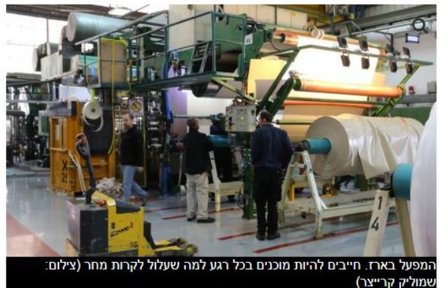
המפעל באר. חייבים להיות מוכנים בכל רגע למה שעלול לקרות מחר

בנוסף לכל אלה, מתמודדת התעשייה הדרומית עם האיום הביטחוני המתמיד, המביא עמו פגיעה נוספת בפריון העבודה, הפסקות ייצור, קושי להסביר ללקוחות בחו"ל את העיכובים הנובעים מסבבי הלחימה, והחשוב ביותר – צורך לתת מענה רצוף למצוקות העובדים ולדיהם.