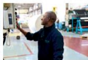
המפעל בארו. המדינה מצדה אמרת: "זה מה יש"

ארו מוצרים תרמופלסטיים" היא חברה תעשייתית שהוקמה לפני 35 שנה בקיבוץ ונמצאת בכעלוח. המפעל מייצר בעיקר לתעשייה של שוק העז - והמרים לחליפות הצלה ולסירות מתגפתות, מוצרים לאיכות הסביבה וגם כוסיים פשוטים. כ-10% מהתוצרת מיוצרת לייצוא.