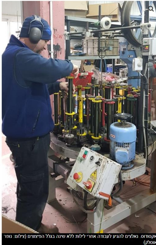
אקסודוס: נאלצים להגיע לעבודה אחרי לילות ללא שינה בגלל הפיצוצים