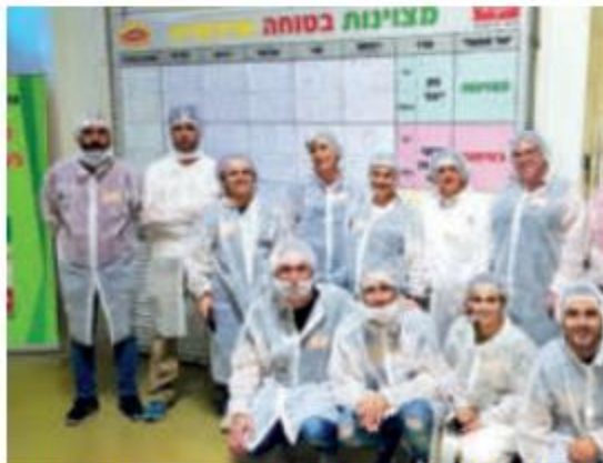
מנהלי ועובדי מרחב צפון ומרחב ירושלים. יום למידה וחוויה

ובעיקר להתנאות, כמה שיש לנגב הצומח להציע לתעשייה, ובכלל. פוטנציאל, העשייה ואנשי הנגב לא קיימים באף מקום אחר בארץ".