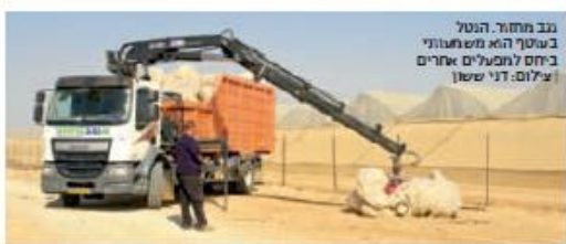
מב מחזור הנטל בשיטת הא משמעותי ביחס למפעלים אחרים

המפעלים "נגב מחזור" ו"רימון" של חברת המחזור "נגב אקולוגיה"