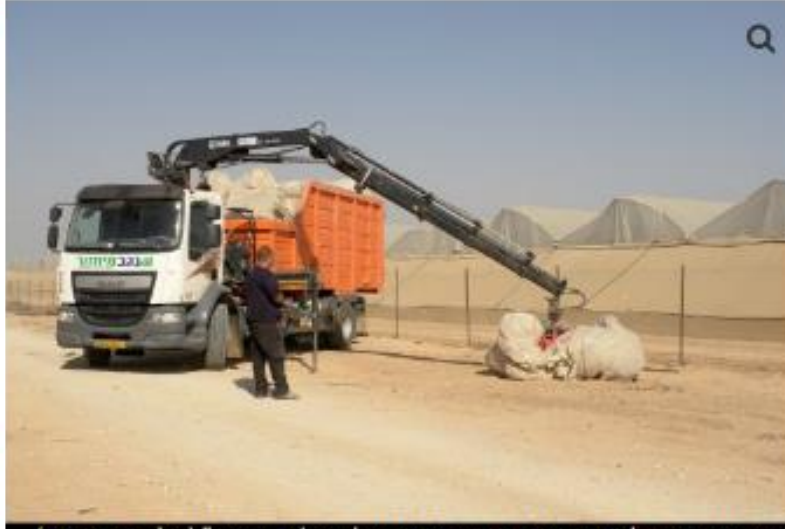
נגב מחזור, הנטל בעוטף הוא משמעותי ביחס למפעלים אחרים"

מפעל "נגב מחזור", הנמצא בקיבוץ סופה ומעסיק כעשרה עובדים, משותק בעת סבבי לחימה. ערך שמרלק, מנכ"ל נגב אקולוגיה, מספר על המצב הלא-פשוט. "כל המתקנים שלנו נמצאים באזור לחימה, וכשיש הסלמה עובדים בנוהל חירום. בסבב האחרון אף נדרשנו להשבית את המפעל בסופה לשלושה ימים. בזמן 'טפסופים' המפעל עובד כי יש בו מיוגיות, אבל אחת הבעיות העיקריות היא שלא שומעים את האזעקה בגלל המכוונות המרעישות ומשום שהעובדים צריכים להשתמש באסמי אוזניים. אנחנו מנסים לסדר פתרון לזה".