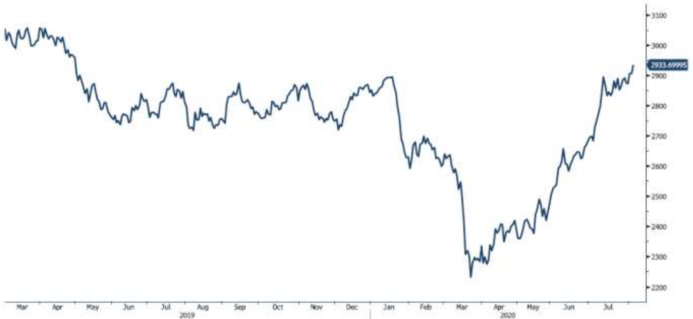
BDIY Index (BDI Baltic Exchange Dry Index)