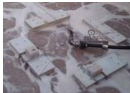
תעשיית מוליכים למחצה, ישראל