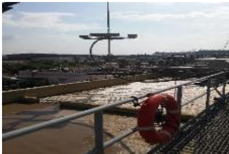
אינטל - ישראל

-חווה שבועי או חודשי ולא מינימום התחייבות