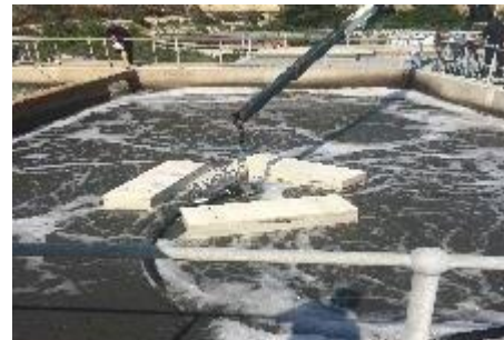
מטי"ש שורק - ישראל