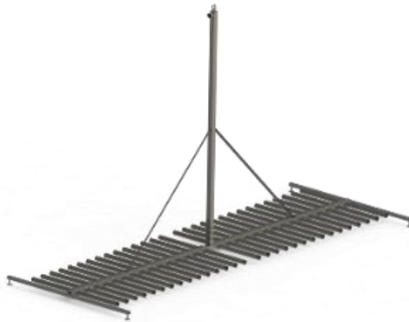
מערכות לא צפות - RFBA