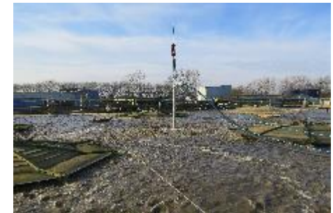
תעשיית המזון - אנגליה