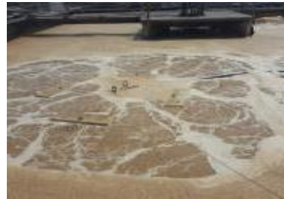
תעשיית הנייר, אינדונזיה