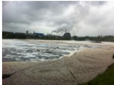
תעשיית הנייר, דרא'פ