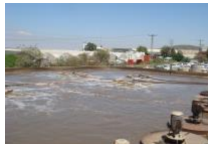
תעשיית המזון, ישראל