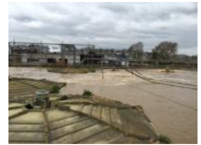
תעשיית המזון, אנגליה