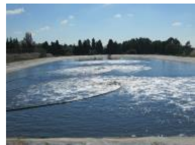
תעשיית דטרגנטים, ישראל