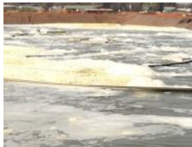
משחטת עופות, דרא'פ