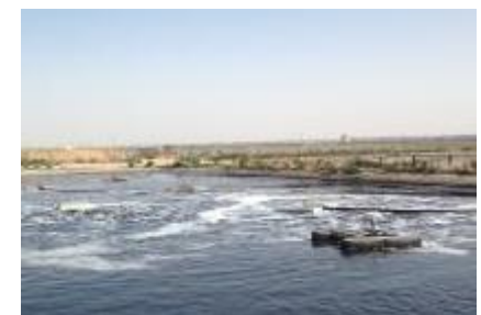
משחטת עופות, ישראל